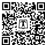
中国电力出版社官方微信