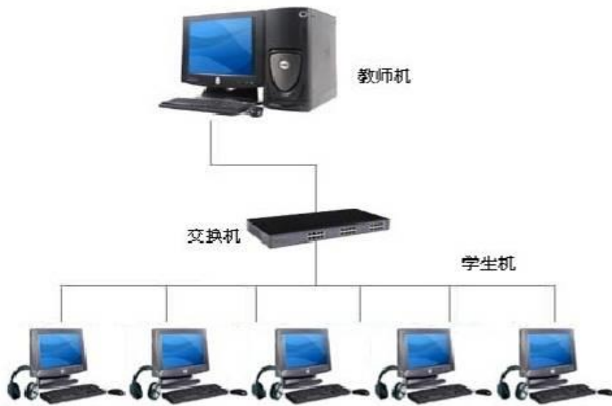
图 1 仿真系统局域网连接示意图